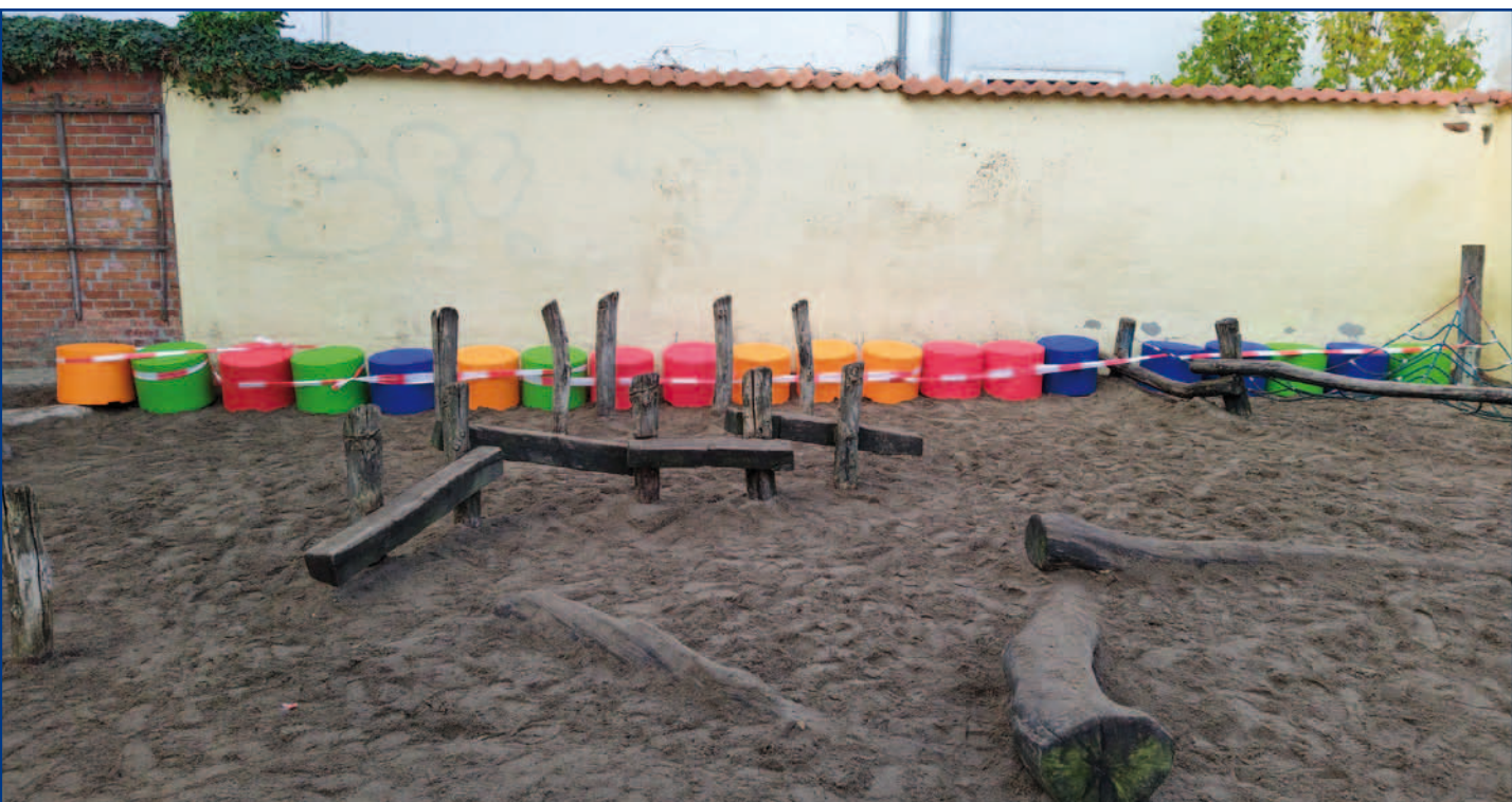
Bsp.eines Schulcafés: Einschulung 2019, Protect-Me-Kids Schlauchmasken, 20 Sitzhocker, Bio-Frühstück unverpackt